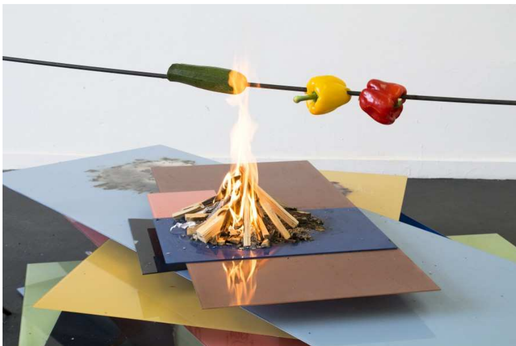
Carolyn Eidner, Untitled (Party Delay 2) , 2013-14.

Vandaag is de opening van Rumour Has It bij Marres, een centrum voor hedendaagse kunst in Maastricht. Negentien jonge kunstenaars, net afgestudeerd aan academies in